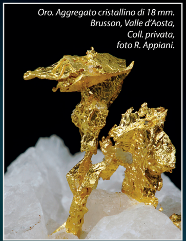
Oro. Aggregato cristallino di 18 mm. Brusson, Valle d'Aosta, Coll. privata, foto R. Appiani.

LINGOTTO International Exhibition Center Via Nizza 294 - 20126 Torino