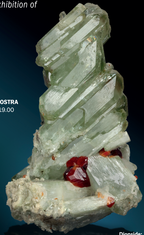
Diopside: Campione di 7,5 cm con grossularia var. hessonite. Testa Ciarva, Val d'Aia, Piemonte. Coll. Tiziano Bonisoli