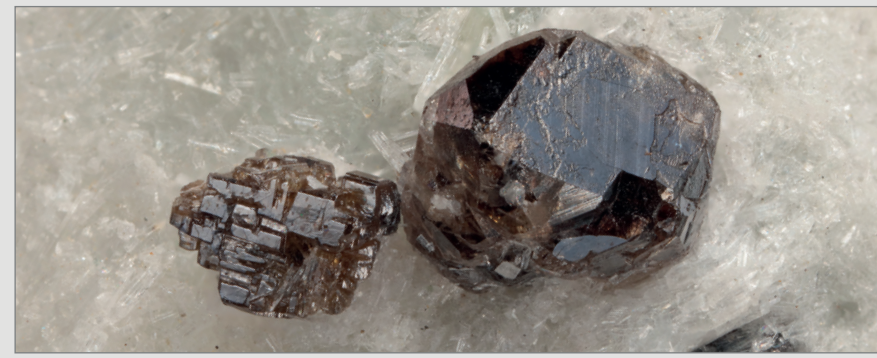
Calzirtite: un eccezionale cristallo di 4 mm associato a un aggregato di cristalli di perovskite. La calzirtite è un raro minerale di zirconio, mentre i cristalli del gruppo della perovskite sono di grande attualità per via dell'impiego nelle tecnologie legate ai pannelli solari. Il campione proviene dalla Rocca di Castellaccio, Valmalenco (SO). Coll. Ivo Scilirioni, foto R. Appiani.